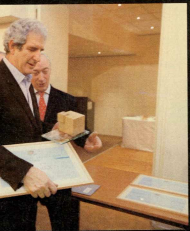
e, président d'Outarex (Etrechy, 91), Œuvre.